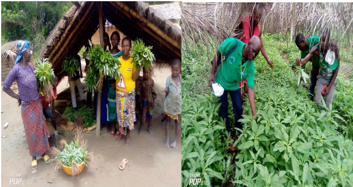
Image 17 : Récolte de l'amarante sur le site de démonstration du village MAKEMBE