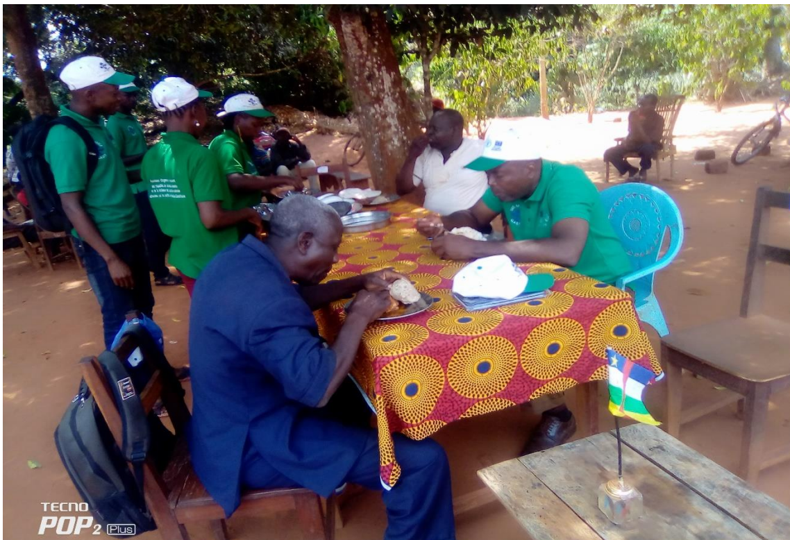
Image 7: Pose déjeunée lors de la cérémonie d'ouverture de formation théorique des DTE