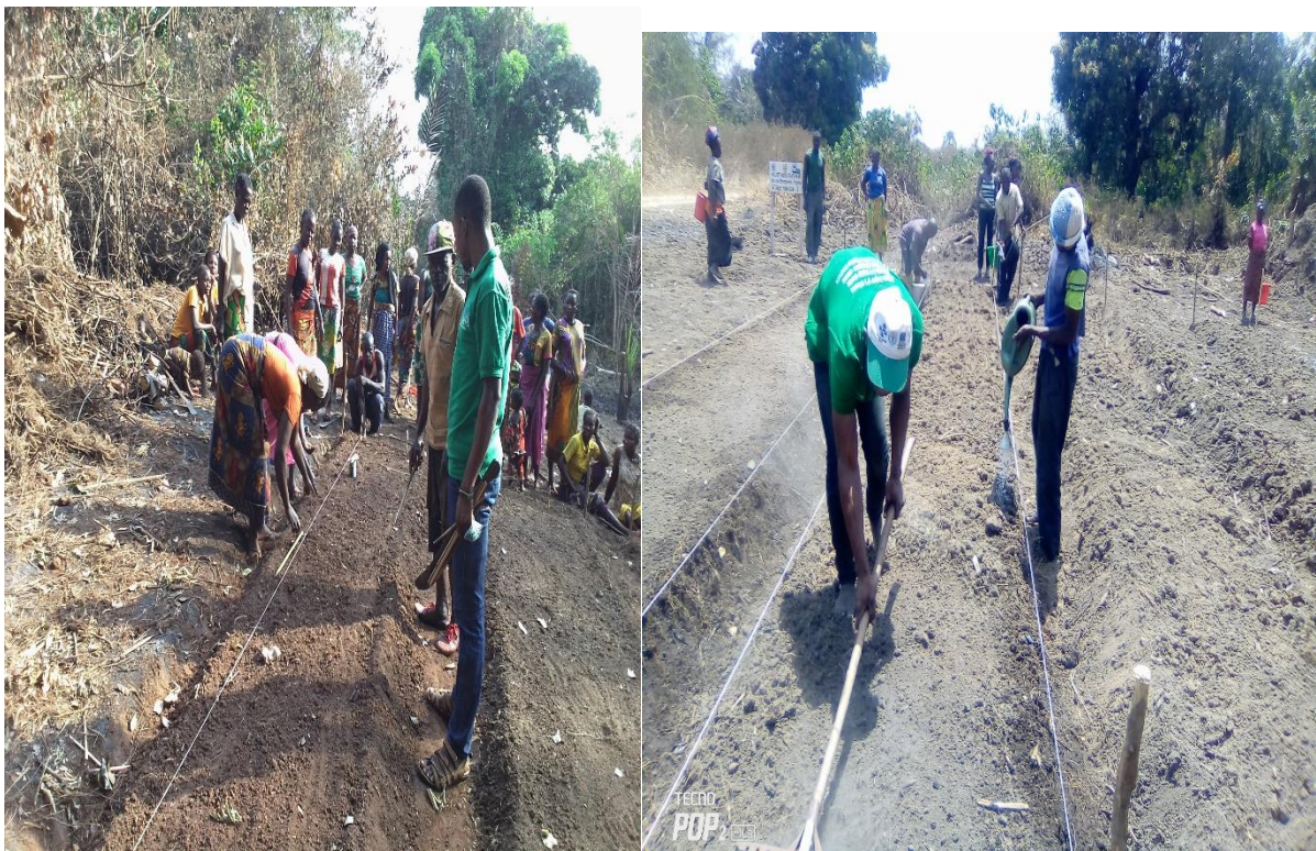
Image 10: Préparation et Semis sur le site de démonstration du village BARAMA

Précisons que la superficie totale des 20 sites de Camps Ecole Paysan était de 2 ha. Chaque site est divisé à 4 blocs ou soles qui contiennent les différentes spéculations telles que le concombre, le gombo, l'amarante, l'épinard et la carotte. Les ménages bénéficiaires ont participé très efficacement aux installations des sites comme il était convenu lors des formations théoriques. Notons qu'ils ont fait preuve de maturité et de responsabilité dans tout leur engagement.