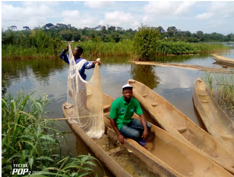
Image 13 : Suivis des activités des pêcheurs aux près de la rivière Mbomou