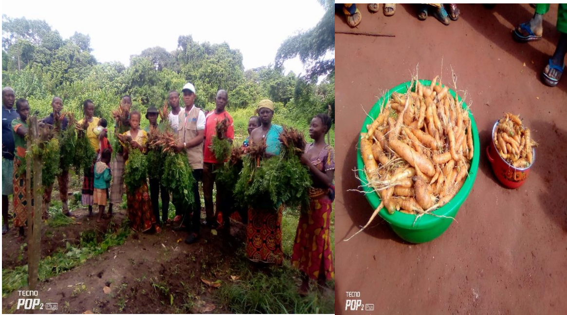
Image 18 : Récolte de la carotte sur le site de démonstration du village GBANGA