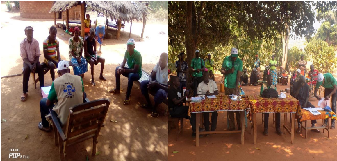
Image 1 : Validation de la liste des bénéficiaires en présence des autorités locales

Les critères retenus (cités ci-haut) ont été rappelés à la communauté pendant la séance de la validation des listes. La liste des ménages bénéficiaires ont été validés par un comité constitué des deux chefs de groupes dont chacun des communes de Zangando-Madabazouma, Vougba-Balifondo et le responsable de la Jeunesse.